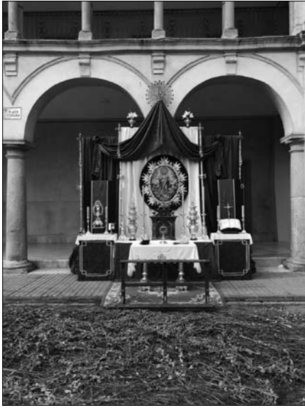
Altar del Corpus, 2018