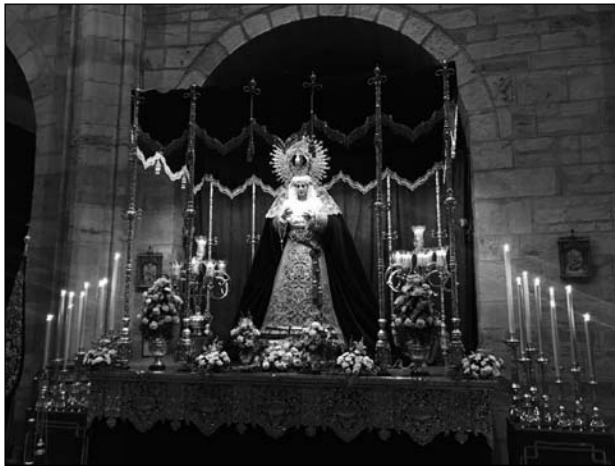
Altar Triduo Esperanza, 2018