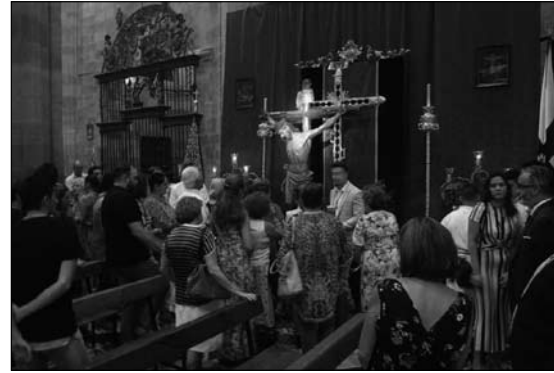
Altar Triduo Providencia, 2018