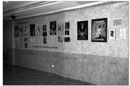
Salón de actos, conferencias, etc.