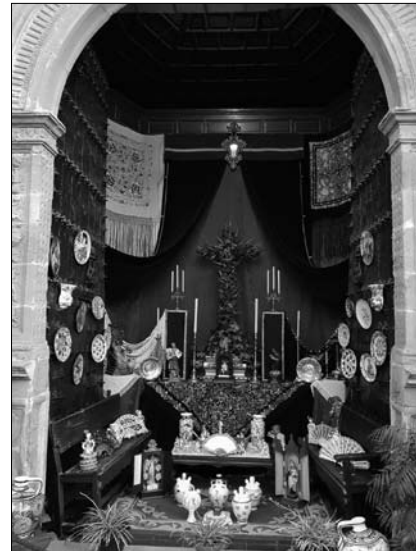
Altar Cruz de Mayo, 2018