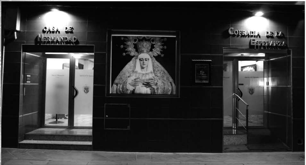
Zona exterior, fachada en calle Feria