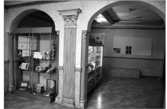
Zona de acceso, barra y merchandising